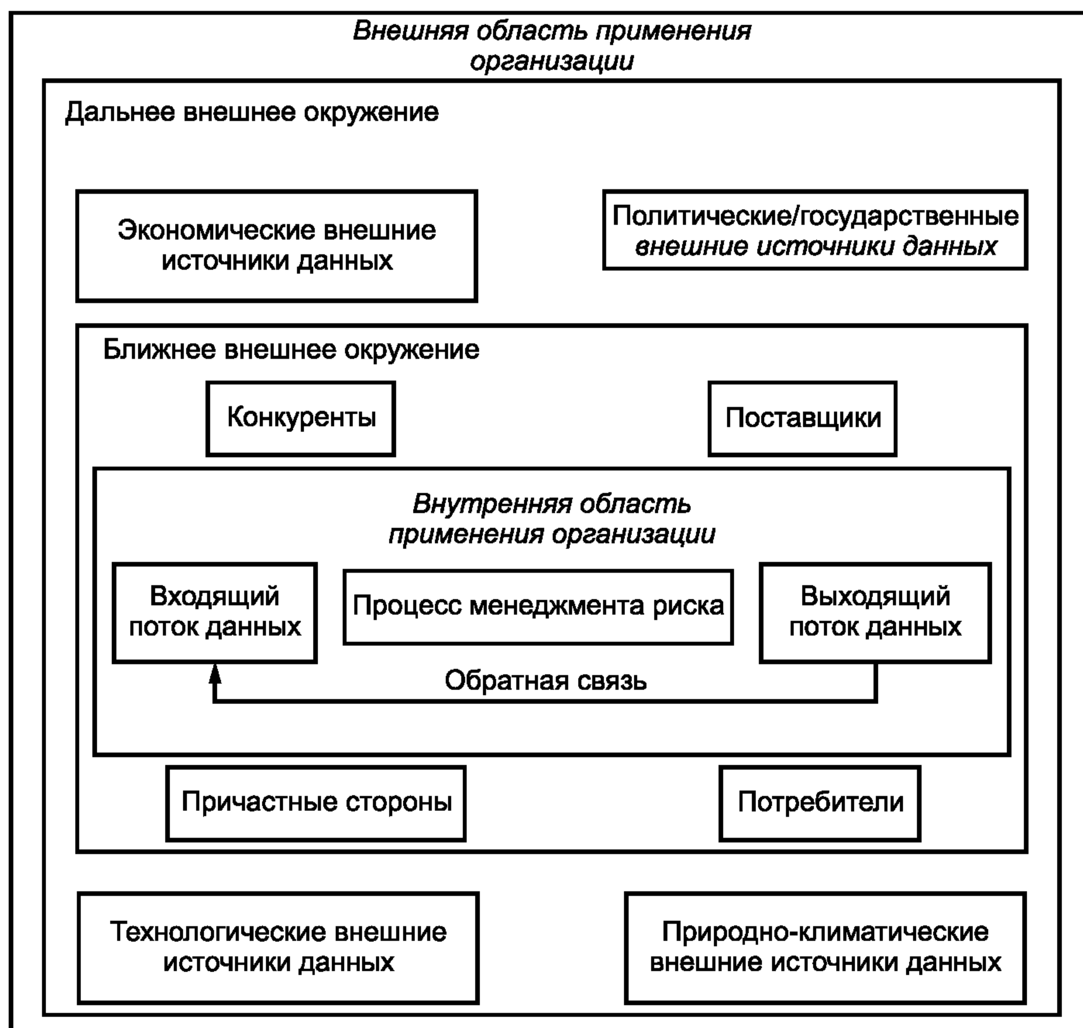
Рисунок 1 — Внешние факторы дальнего и ближнего окружения

Ближнее внешнее окружение представлено факторами делового окружения. К ним относятся потребители, поставщики, конкуренты, акционеры, инвесторы. Руководство организации способно оказать определенное влияние на данные факторы.